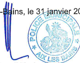
Le Maire d'Aix-les-Bains Renaud BERETTI